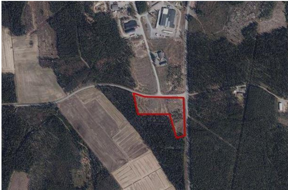
Kuva 1. Kaava-alueen likimääräinen raja esitettynä punaisella viivalla.

Suunnittelualue sijaitsee Kihniön kunnassa noin 1–2 kilometrin päässä Kihniön keskustataajamasta lounaaseen. Alue on kooltaan noin 2,4 hehtaaria. Alue rajautuu idästä Järvisuomentiehen ja pohjoisesta Pyhäniementiehen.