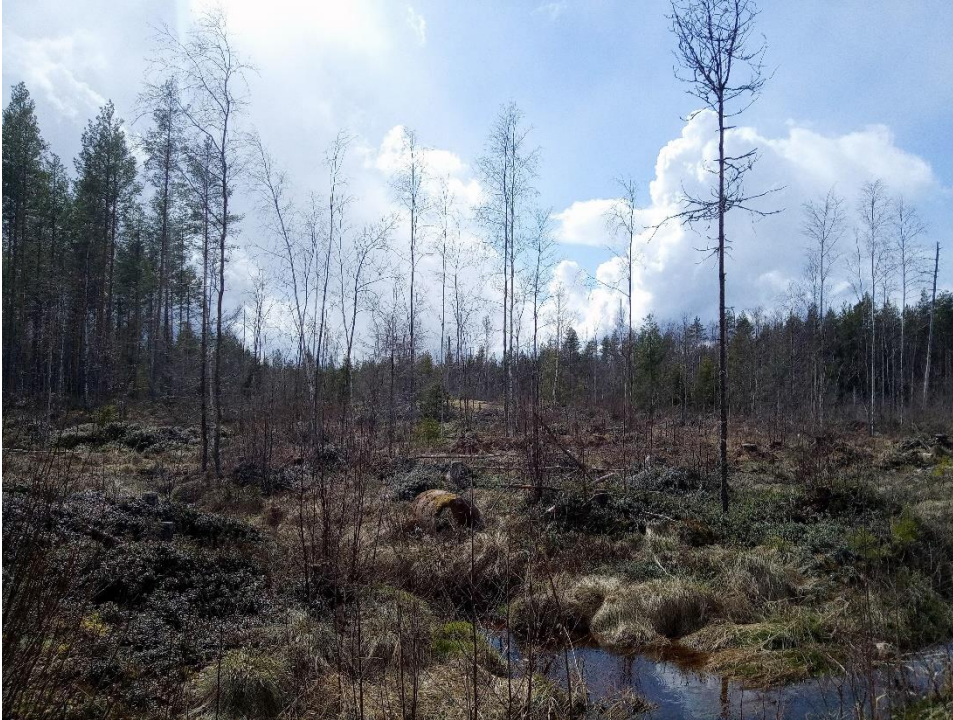
Kuva 3. Vähä-Pyöränevan maastonäkymää.