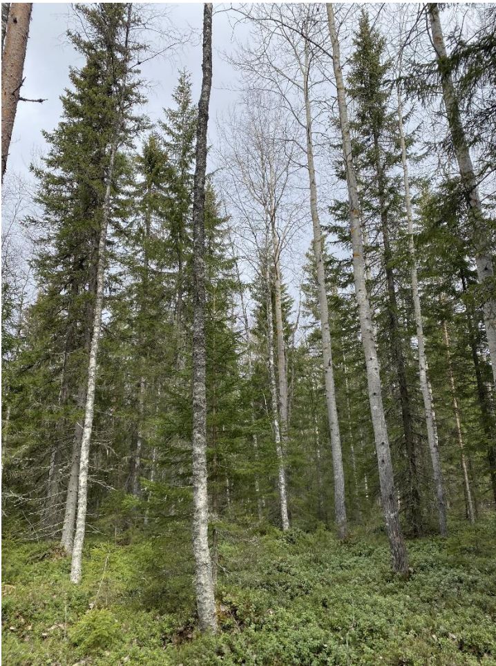
Kuva 2. Haapa-kuusisekametsää Välinevan maastossa.

Närhinkankaan tuulipuiston suunnittelualueella tehtiin huhti-toukokuussa 2023 liito-oravakartoitus kahden luontokartoittajan toimesta. Tämä selvitys on laadittu tuulivoimaloiden suunnittelutyön tueksi. Selvityksessä on lisäksi kuvattu liito-oravan elinympäristöjä ja elintapoja. Aiemmat liito-oravahavainnot suunnittelualueella ja sen lähiympäristöstä haettiin Lajitietokeskuksen käyttörajoitetuista aineistoista.