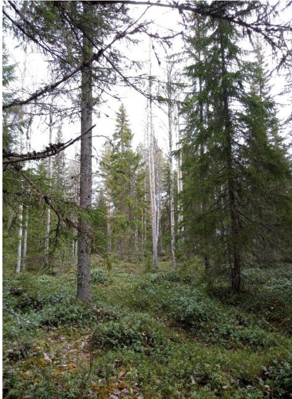
Vähä-Närhinneva, Kihniö.