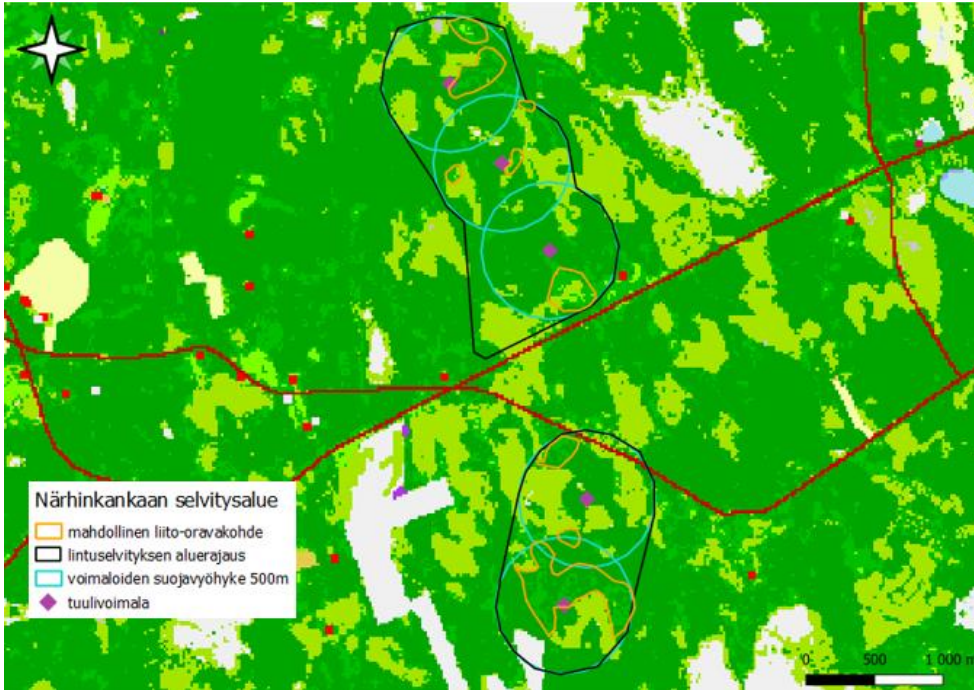
Kuva 4. Suunnittelualue esitettyä CORINE2018-maanpeitekarttatasolla. Vihreät alueet esittävät tietyn puulajin hallitsemia alueita. Oranssilla merkityt alueet ovat niitä, joissa näkyi todennäköisintä liito-oravalle sopivaa puustoa.